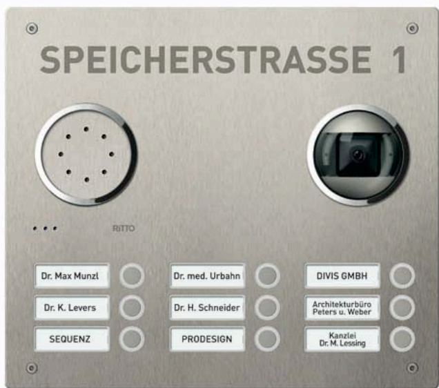
Individuelle Gravuren können in die edle Türstationen Acero eingefügt werden. Hier eine Variante für 9 Wohneinheiten mit Videokamera .