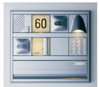
Portier Türstation: Herzstück des RITTO Türsprechanlagen- systems