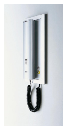
RITTO Wohntelefon TwinBus mit Nachtdesign im formschönen Unterputz-Rahmen

Das Basismodell TwinBus Wohntelefon 17630 verfügt serienmäßig über einstellbare Ruflautstärke, Mithörsperre sowie über eine Rufunterscheidung zum Erkennen, ob an der Haus- oder Wohnungstür geläutet wird. Zusätzliche Funktionen bietet das TwinBus Wohntelefon Komfort 17650, mit dem bis zu acht Teilnehmer hausintern kommunizieren sowie acht zusätzliche Schaltbefehle ausgeführt werden können. Individuell lassen sich fünf bzw. acht unterschiedliche Rufsignale sowie ein melodischer 3-Klang-Gong einstellen, um zwischen Tür-, Etagen- oder Internruf zu unterscheiden. Optisch deutlich macht dies zudem auch eine blinkende Rufanzeige. Und wenn man mal ungestört