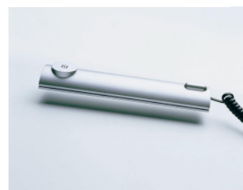
RITTO TwinBus Wohntelefon Hörer: geradlinig, stilvoll und zeitlos im Design. Der flache, griffbereite Hörer liegt stets sicher in der speziellen Halterung