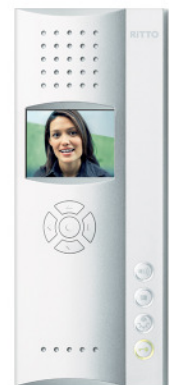
Mehrfach mit internationalen Designpreisen ausgezeichnet: Die Video-Freisprechstelle Color von Ritto.

Ob als Hausstation mit Hörer oder als Freisprechstelle mit intelligenter Sprachsteuerung – schon auf den ersten Blick beeindruckend die neuen RITTO Video-Color-Produkte durch ihr flächiges Design und die geringe Aufbauhöhe. Selbst bei kostensparender Aufputzmontage präsentiert sich das Gehäuse schlank und elegant. Natürlich ist auch eine Unterputz-Installation oder der Einsatz als Tischgerät möglich. Mit ihrer schlanken Linie bietet sich die Video-Freisprechstelle Color –